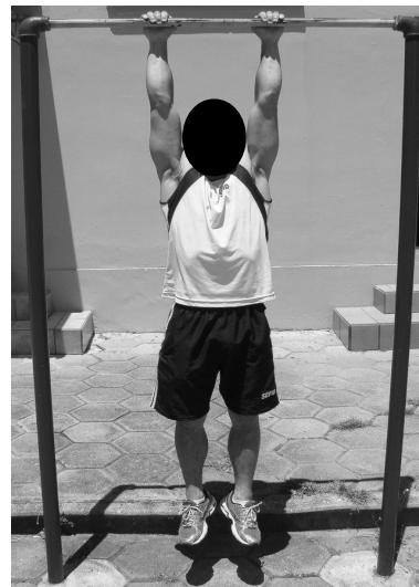
POSIÇÃO 3- Final do exercício