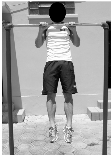
POSIÇÃO 2- Intermediária