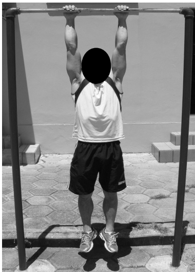
POSIÇÃO 1- Inicial